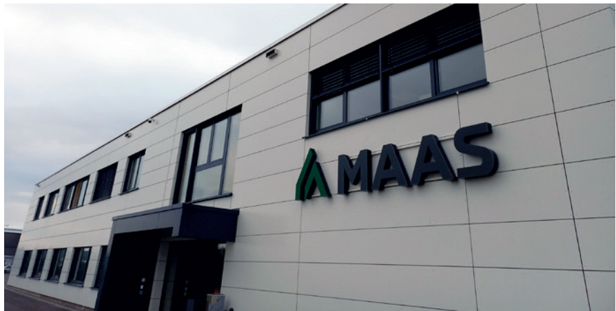
Foto: Maas Profilzentrum mit Planbond Alu-Verbundplatten.